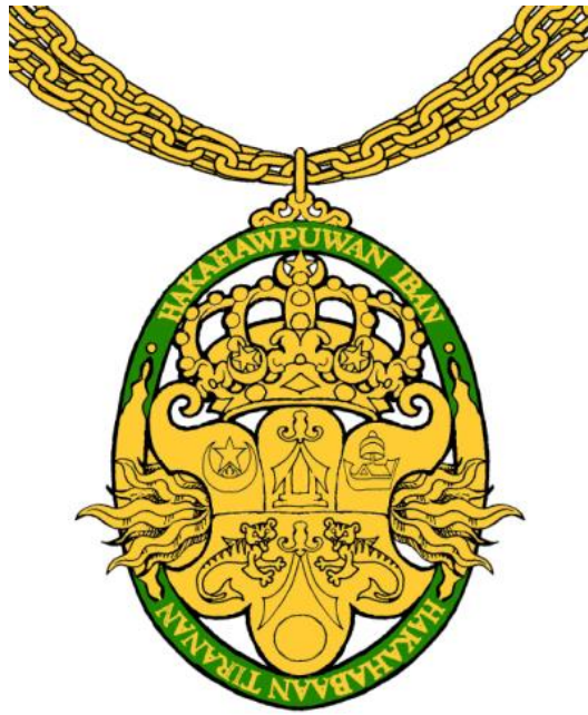
Emblema del Kadí de la Orden