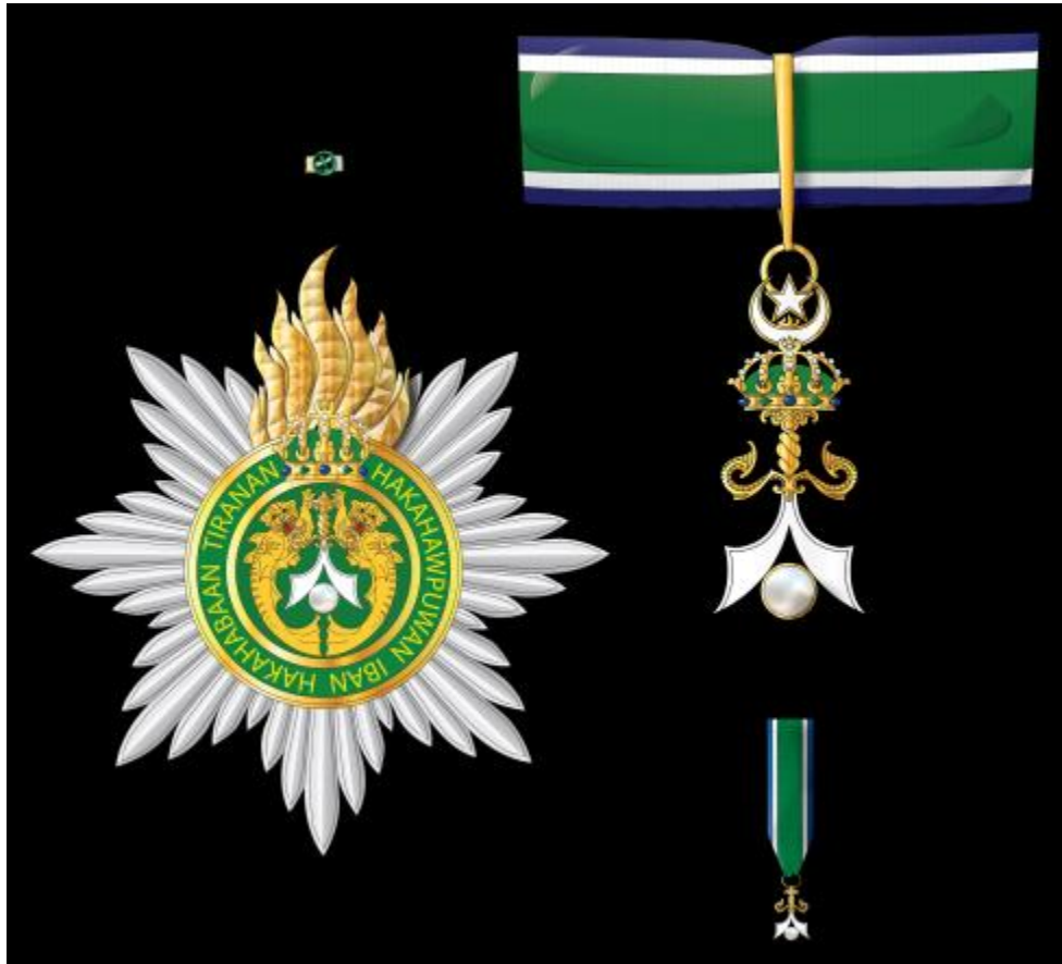
Regalía de Compañero Distinguido en la Orden de la Perla de Sulú