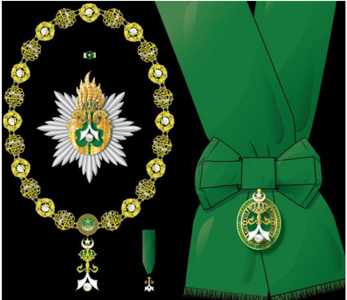
Regalía del Collar de la Orden de la Perla de Sulú