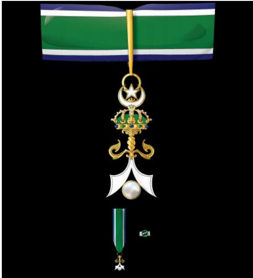
Regalía de Compañero de la Orden de la Perla de Sulú