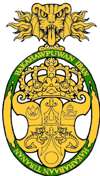
Emblema del Canciller de la Orden