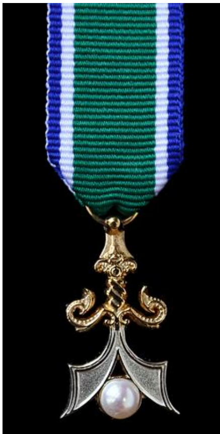
Miniatura de la insignia de la Orden de la Perla realizada por Cejalvo.

Promueve los nobles valores de la aristocracia Tausug tanto en Sulú como en la diáspora de los tausug por todo el mundo.