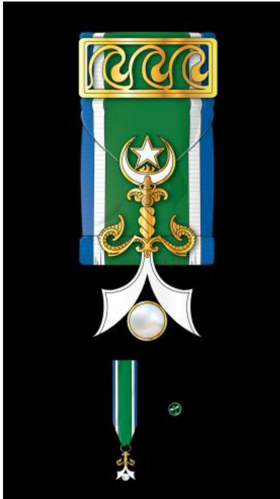
Regalía de Miembro de la Orden