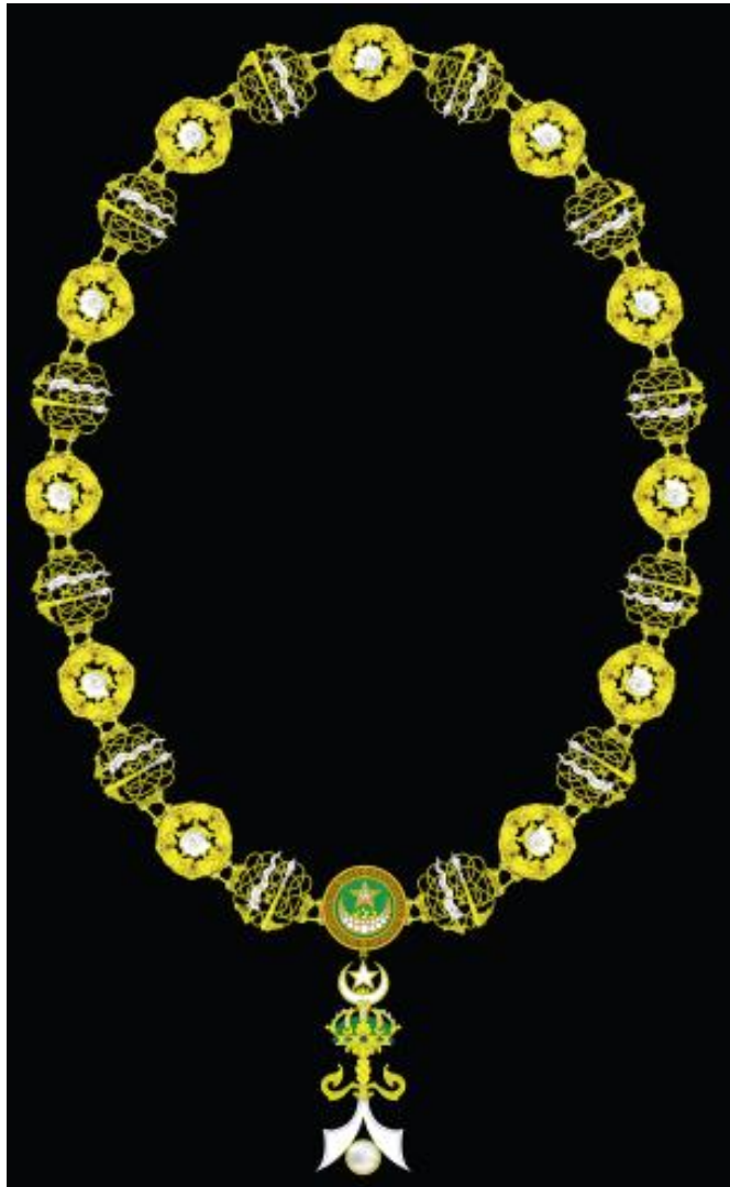
Collar de la Orden de la Perla de Sulú

supernumerarios y por lo tanto no computan con respecto al límite máximo de concesiones.