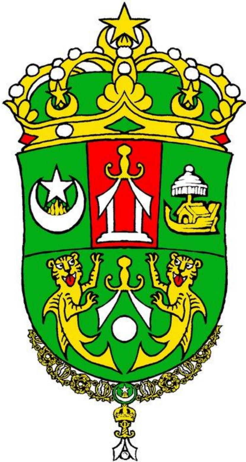
Armas de la Real y Hachemita Orden de la Perla de Sulú