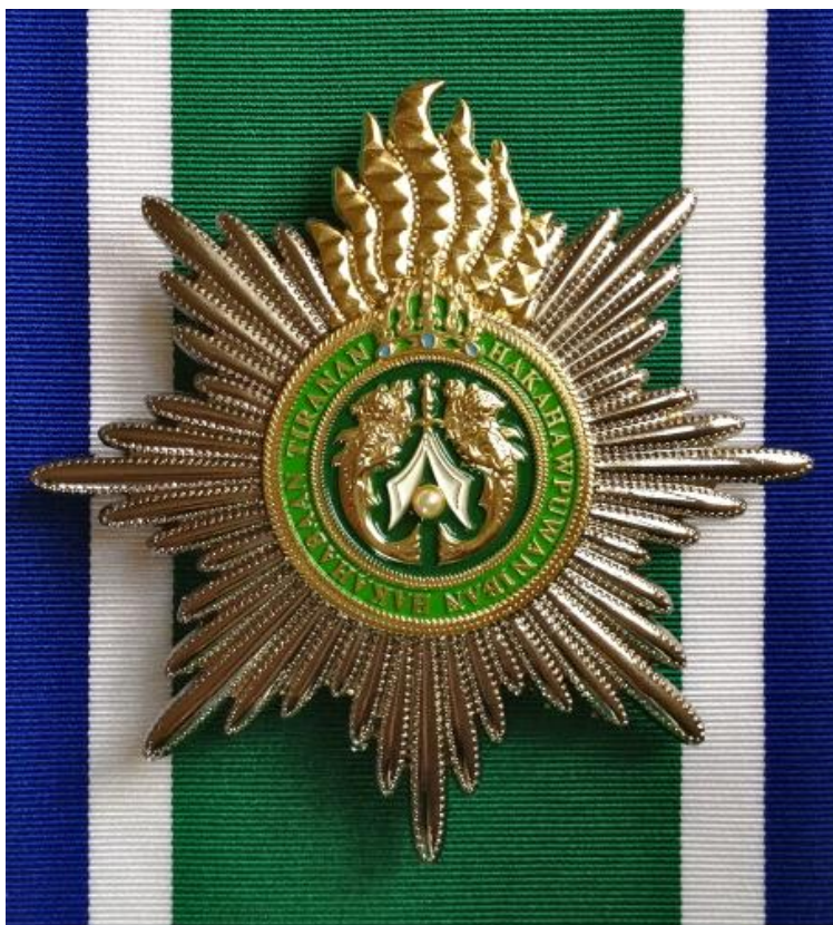
La Placa-Estrella del Gran Cordón

La Orden es una corporación honorífica y nobiliaria instituida como Orden Dinástica siguiendo el modelo de las tradicionales órdenes de caballería análogas, siguiendo las antiguas costumbres y distinciones que tradicionalmente ha discernido el Real Sultanato de Sulú y la Corte del Sultán.