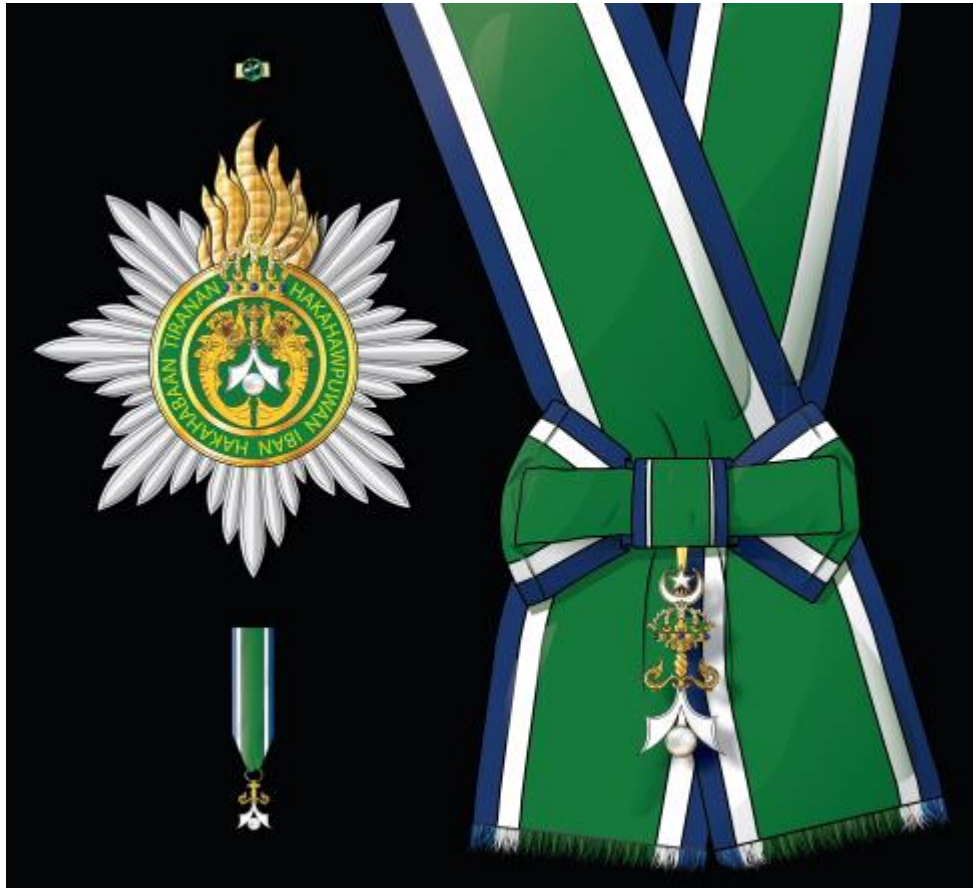
Regalía del Gran Cordón de la Orden de la Perla de Sulú