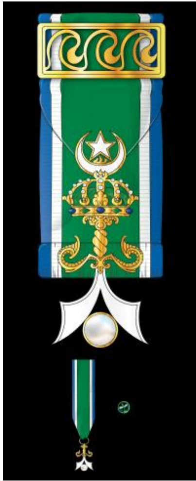
Regalía de Oficial de la Orden