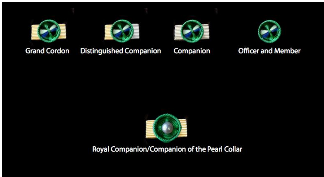
Rosetas de la Orden de la Perla de Sulú